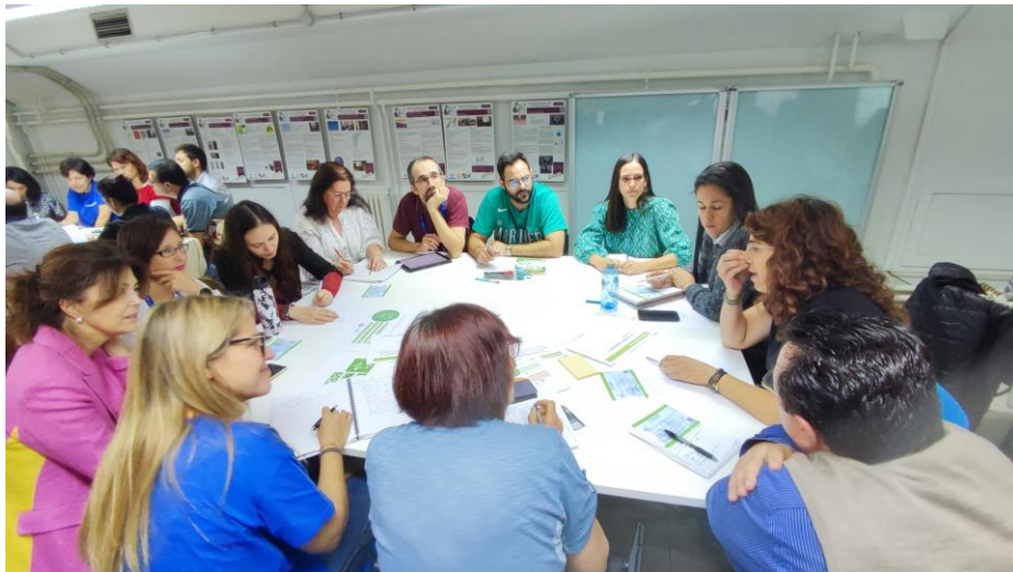
Grupo de trabajo 2