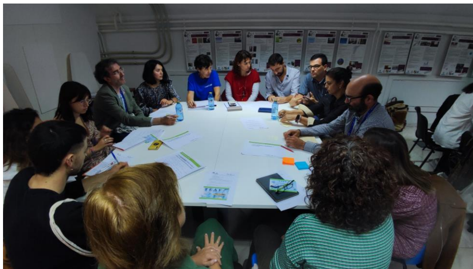
Grupo de trabajo 4