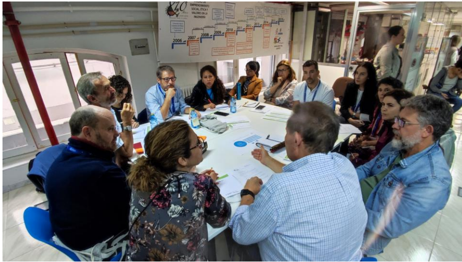
Grupo de trabajo 1