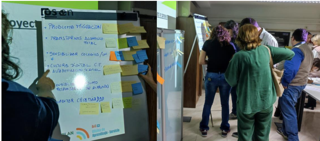
Valoración de los resultados a nivel individual por cada uno de los participantes.

Los resultados generados desde cada uno de los grupos de trabajo fueron expuestos y anotados para ser valorados por cada uno de los participantes para facilitar la integración y conexión entre agentes, el debate y reflexión conjunta.