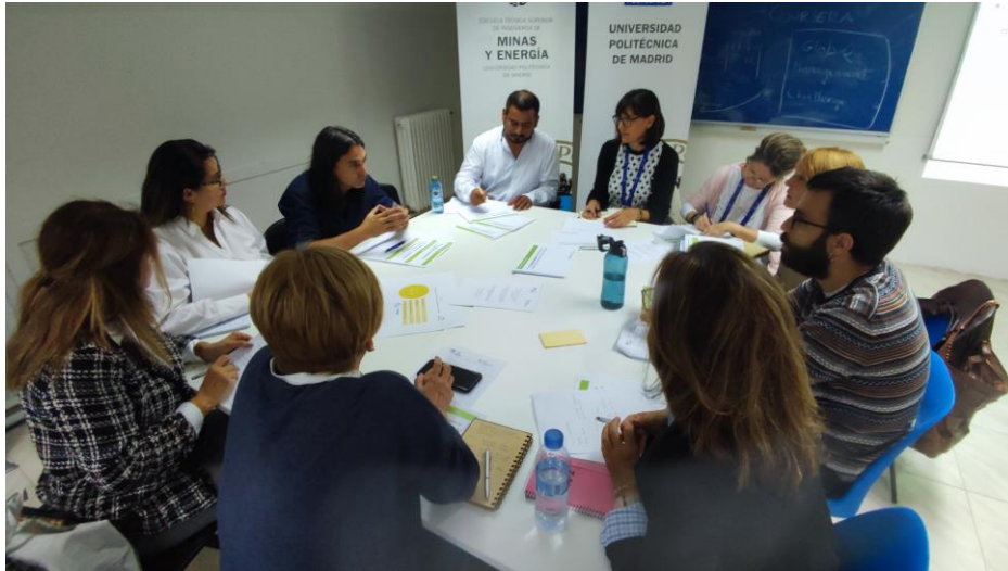
Grupo de trabajo 3